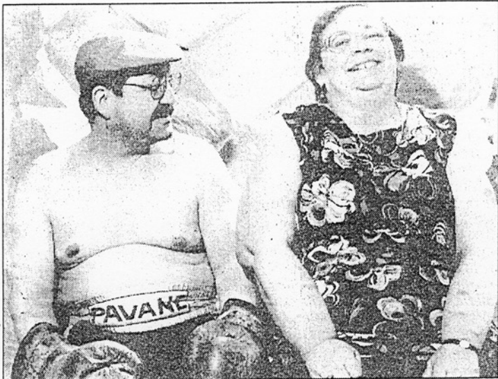
Human Box, des images à la fois temporelles et intemporelles

Surprenant de voir cette jeune demoiselle, âgée de 27 ans,