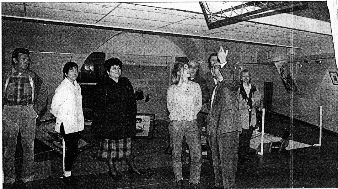
A l'occasion du vernissage "Humans box" jusqu'au 16 février. Du mardi au vendredi de 16 à 19 h, samedi de 10 à 12 h.