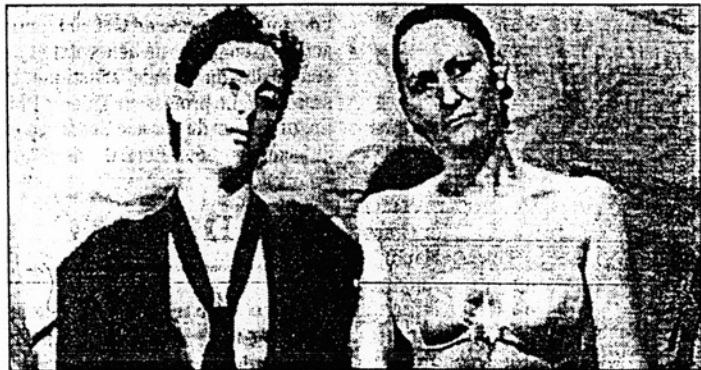
Gants de boxe ou mains nues dans le studio d'Isabelle Fournier.

"J'ai voulu travailler sur le couple, le duo, le duel. Chaque personnage voulait être déguisé mais au moment où je prenais les photos, tous redevenaient eux-mêmes. J'aime bien travailler sur la mémoire, dévaler les données comme le temps et l'espace. J'ai surtout cherché à mettre