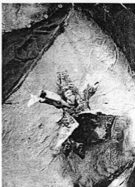
Le monde entier est un théâtre, dit le programme, shakespeareien